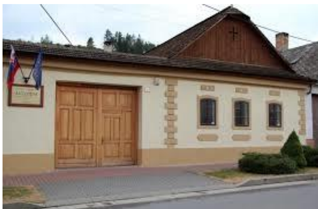
Meštiacky dom - národná kultúrna pamiatka

Alojz Schuster a Múzeum kinematografie rodiny Schusterovej -ucelená kolekcia kinematografickej techniky, etnografická zbierka a dokumenty hámorníckej výroby